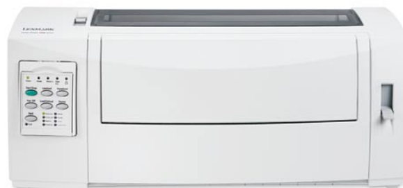
Drukarka igłowa Lexmark 2590+